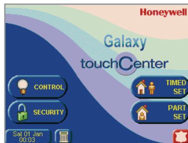
Écran d'accueil standard