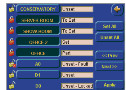
Etat des groupes de MES