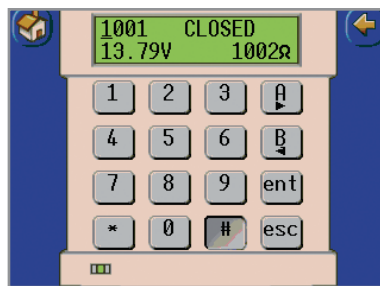
Emulation du clavier MK7