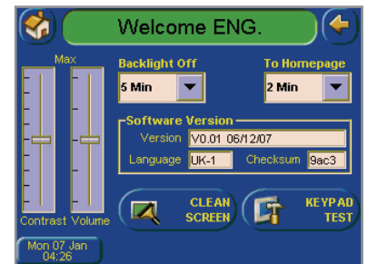
Réglage du TouchCenter