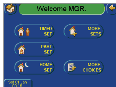
Écran de MES/MHS