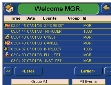
Journal des évènements